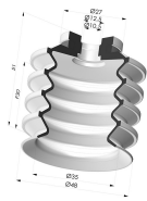
Ventouse 4.5 Soufflets Série 92 Ø 50MM