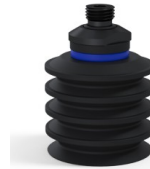
Référence déclinaison : 92 50NI 14D-2-F