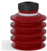
Référence déclinaison : 92 50SL 18D-2-F