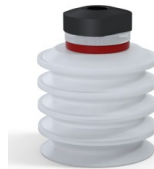
Référence déclinaison : 92 50SLT 18D-2-F