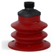
Référence déclinaison : 96 52SL 14D-2-F