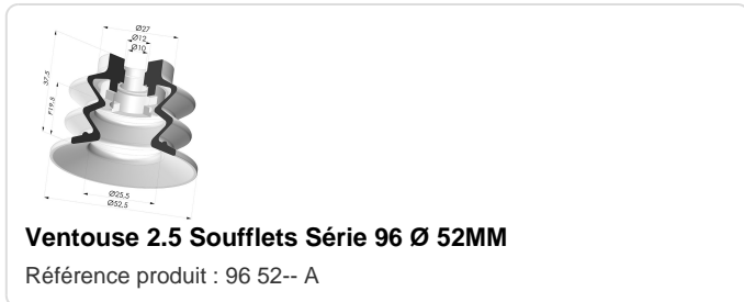
Ventouse 2.5 Soufflets Série 96 Ø 52MM