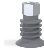
Référence déclinaison : 95 40NR N