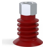
Référence déclinaison : 95 40SL N