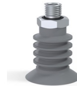
Référence déclinaison : 95 40NR O