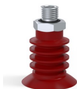
Référence déclinaison :