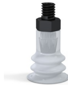
Référence déclinaison : 96 15SLT M5