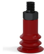
Référence déclinaison : 96 15SL M5