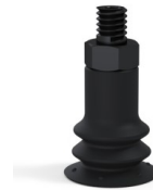
Référence déclinaison : 96 15NI M5