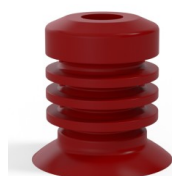
Riferimento variante: 95-2 50SL A