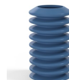
Riferimento variante: 81A 40SLBLEU A