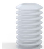
Riferimento variante: 81A 40SLT A