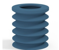
Riferimento variante: 8K 50SLDB A