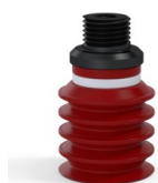
Riferimento variante: 92 20SL M18D