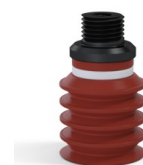
Riferimento variante: 92 20SLBRIQUE 18D