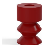
Riferimento variante: 1 11-2SL A