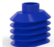
Riferimento variante: 4PA56-2 38 50SLB A