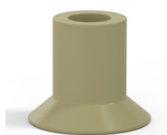
Riferimento variante: 73A 20CN A