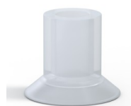
Riferimento variante: 73A 20SLT A