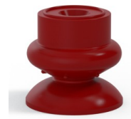
Riferimento variante: 80A 25SL A SH30