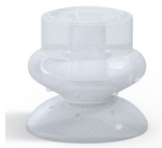
Riferimento variante: 80A 25SLT A