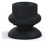
Riferimento variante: 80A 25NI A