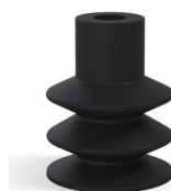
Riferimento variante: 85 30NI A