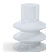
Riferimento variante: 85 30SLT A