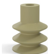
Riferimento variante: 85 30CN A