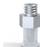
Riferimento variante: 9 07SLT M5M