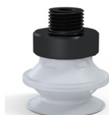
Riferimento variante: 91 20SLT M18