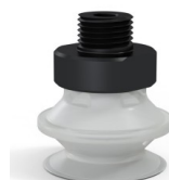
Riferimento variante: 91 20TPU M18