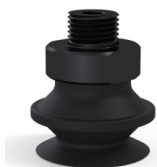
Riferimento variante: 91 20NI M18