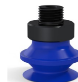
Riferimento variante: 91 20PU M18