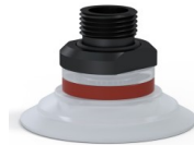
Riferimento variante: 9 50SLT 38D-2