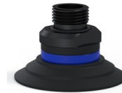
Riferimento variante: 9 50NI 38D-2