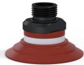
Riferimento variante: 9 50SL 38D-2