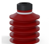
Riferimento variante: 92 40SL 18D-2-F