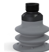
Riferimento variante: 96 35NR 14D-2-F