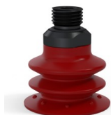
Riferimento variante: 96 35SL 14D-2-F