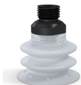
Riferimento variante: 96 35SLT 14D-2-F