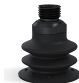
Riferimento variante: 96 35NI 14D-2-F