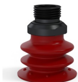
Riferimento variante: 96 35SL 38D-2