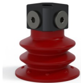
Riferimento variante: 96 52SL 18D-3-BD