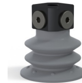
Riferimento variante: 96 52NR 18D-3-BD