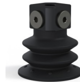
Riferimento variante: 96 52NI 18D-3-BD