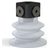
Riferimento variante: 96 52SLT 18D-3-BD