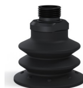
Riferimento variante: 96 52NI 38D-2