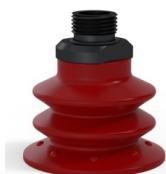
Riferimento variante: 96 52SL 38D-2