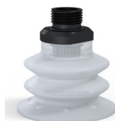
Riferimento variante: 96 52SLT 38D-2