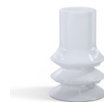
Referência da variação: 88B 20SLT A