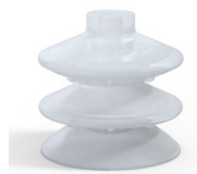
Referência da variação: 2 87SLT A