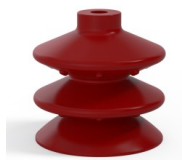
Referência da variação: 2 87SL A