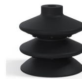
Referência da variação: 2 87NI A