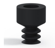
Referência da variação: 21 05NI A