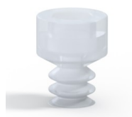
Referência da variação: 21 05SLT A