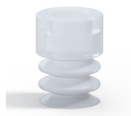
Referência da variação: 21 07SLT A