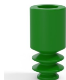
Referência da variação: 8 04SLV A