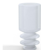
Referência da variação: 8 04SLT A