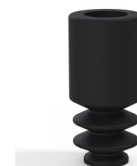
Referência da variação: 8 04NI A