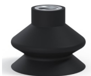
Referência da variação: 8A 44NI F14 • Cor: Preto • Dureza da costa: SH50 • Matéria: Nitrila