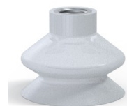
Referência da variação: 8A 44SLT F14 • Cor: Translúcido com certificação CE para contato com alimentos • Dureza da costa: SH60 • Matéria: Silicone