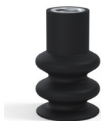
Referência da variação: 8B 30NI F14 • Cor: Preto • Matéria: Nitrila