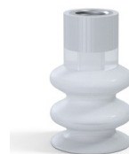
Referência da variação: 8B 30SLT F14 • Cor: Translúcido • Matéria: Silicone