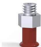
Referência da variação: 9 07SL M5M