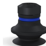
Referência da variação: