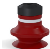
Referência da variação: