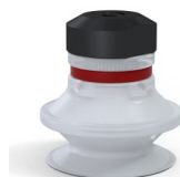
Referência da variação: