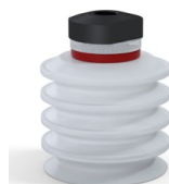
Referência da variação: 92 50SLT 18D-2-F