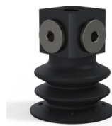
Referência da variação: 96 35NI 18D-3-BD